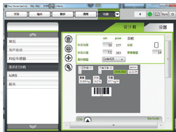
设置：确定标签设计